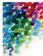
Stiege 7 Wir suchen SIE!